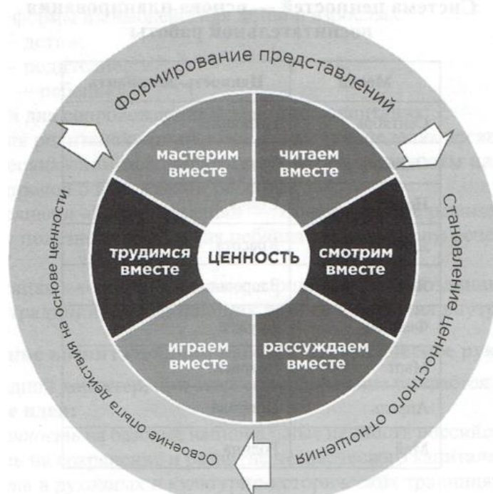
Рис. Педагогическая модель формирования ценностных ориентации у дошкольников

В центре графической модели находится круг со словом «Ценность», при этом каждый месяц ценность-доминанта меняется.